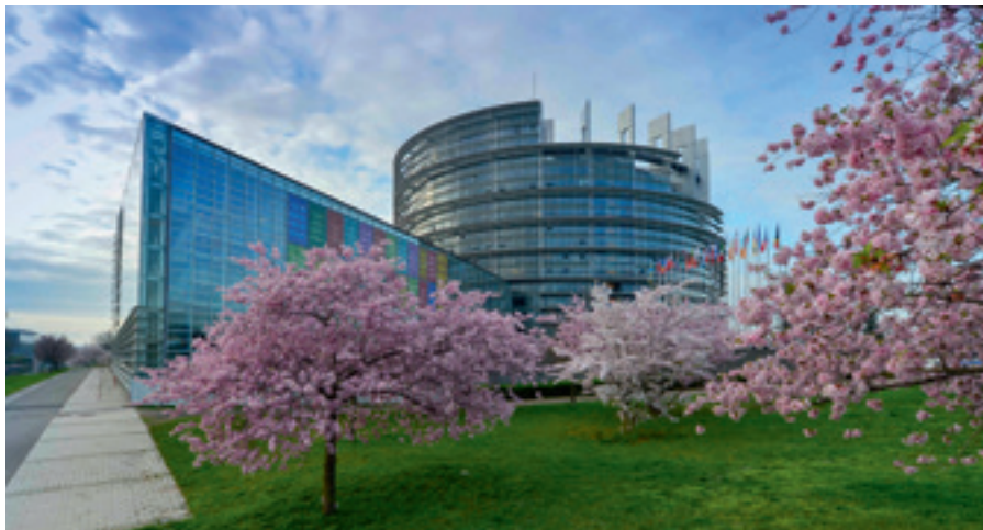
© Europska unija 2014. Izvor: EP Zgrada Louise WEISS. © Architecture Studio