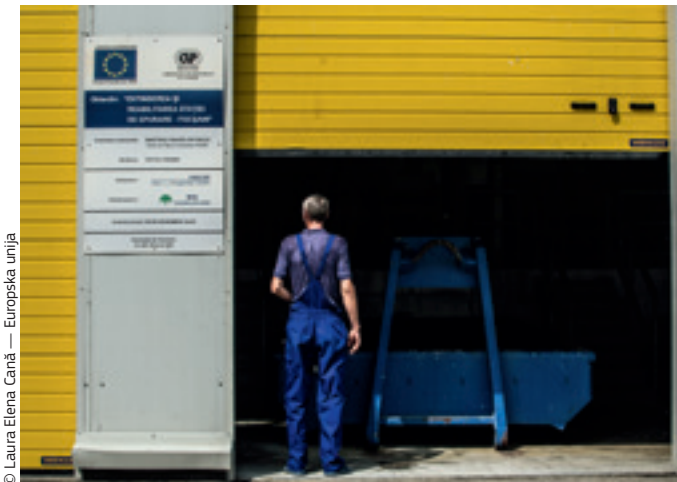
© Laura Elena Canã — Europska unija

Komisija je objavila Proračun EU-a u mojoj zemlji (1) , seriju od 28 informativnih članaka u kojoj se ističu odabrani projekti financirani iz proračuna EU-a u svim državama članicama. Projekti pokrivaju širok raspon područja, od zapošljavanja, regionalnog razvoja, istraživanja i obrazovanja do okoliša, humanitarne pomoći i brojnih drugih područja. Projekti mogu nadahnuti potencijalne podnositelje zahtjeva koji također mogu saznati više o dodanoj vrijednosti koju je EU donio tim projektima.